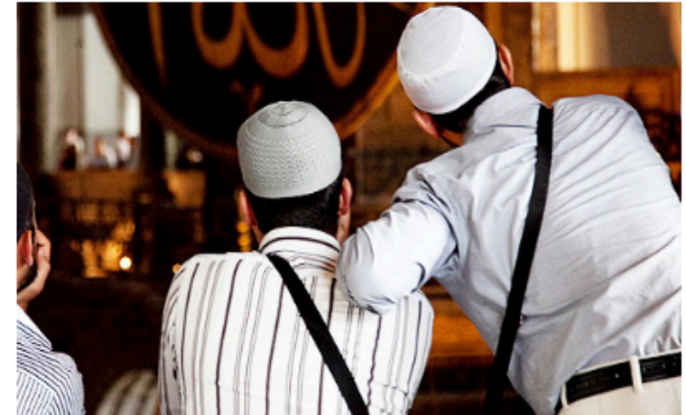
Muslime