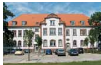
Staatliches Schulamt für den Main-Kinzig-Kreis

EVANGELISCHE KIRCHE VON KURHESSEN-WALDECK