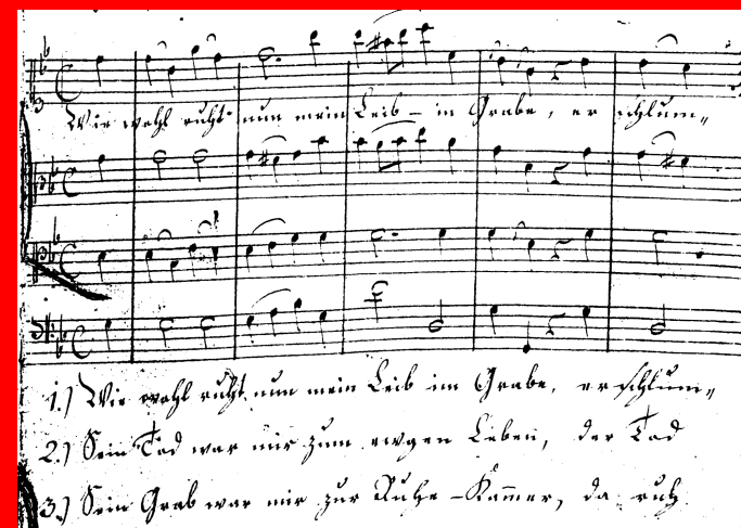
Handschrift Johann Michael Bachs aus der Forschungsbibliothek Gotha: Mus. 66/1