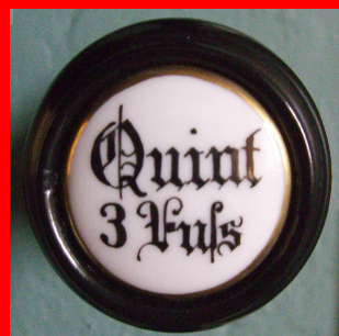
Registerzug der Lahrbacher Orgel

Eintritt jeweils frei! Kollekten am Ausgang