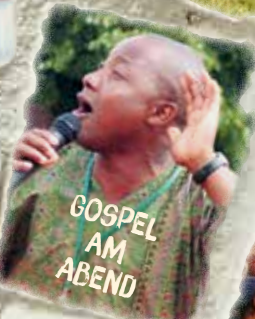
GOSPEL AM ABEND