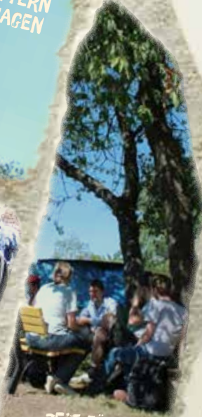
ZEIT FÜR BEGEGNUNGEN