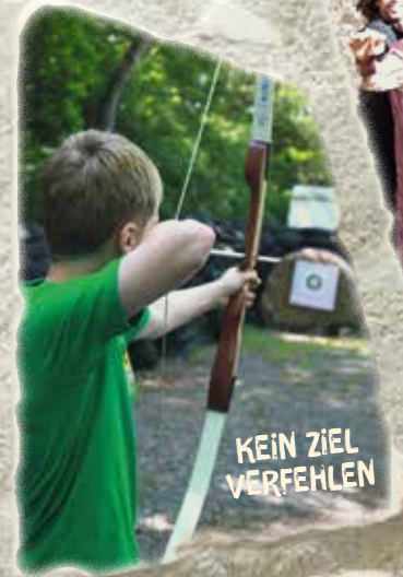
KEIN ZIEL VERFEHLEN