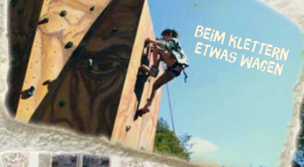
BEIM KLETTERN ETWAS WAGEN