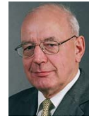
Volker Arlt Steuerberater Kirchhain Kirchenkreis Kirchhain