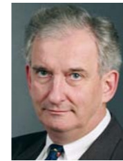
Reinhold Kalden Propst des Sprengels Kassel