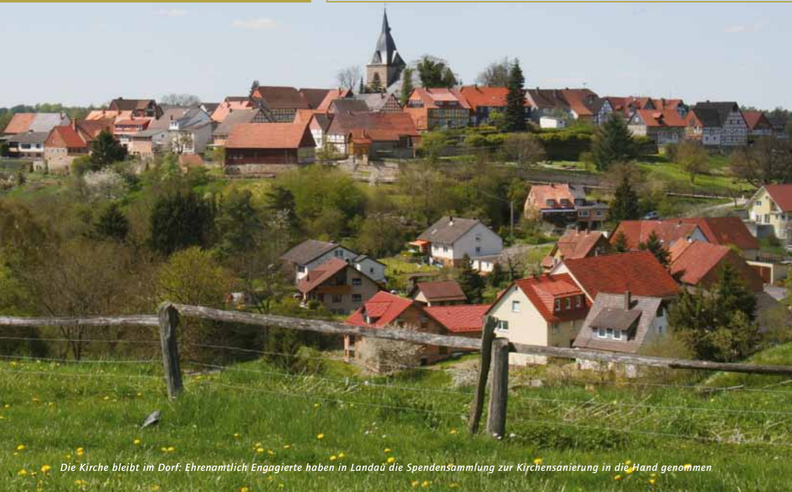
Die Kirche bleibt im Dorf: Ehrenamtlich Engagierte haben in Landau die Spendensammlung zur Kirchensanierung in die Hand genommen