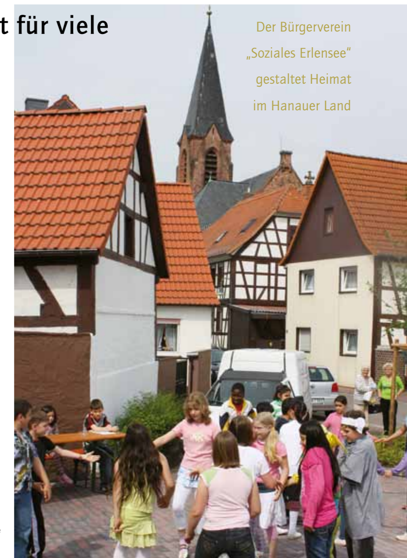
Der Bürgerverein „Soziales Erlensee“ gestaltet Heimat im Hanauer Land