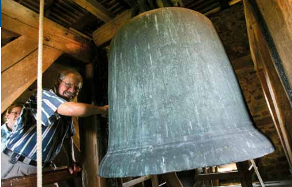
Die fast 1.000 Jahre alte Lullusglocke läutet an hohen kirchlichen Feiertagen in der Stiftsruine Bad Hersfeld – und jederzeit im Internet

■ Manchmal reicht ein typischer Geruch, um Kaskaden an Heimatgefühlen auszulösen, oder ein bestimmtes Landschaftsbild, das diese schmerzhaft-schöne Wehmut des Vergangenen beschwört. Nicht weniger intensiv können Klänge augenblicklich in die Kindheit zurückführen und Heimatgefühle aufrufen. Besonders Kirchenglocken haben diese Kraft. Das erfuhr der Hessische Rundfunk, als man dort eine Landkarte mit zahlreichen hessischen Kirchenglocken zum Anklicken und Anhören ins Internet stellte.