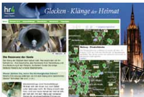
Interaktive Glockenkarte des Hessischen Rundfunks auf www.hr4.de , Rubrik „Glocken“ anklicken

das Gefühlsleben hinein. Glocken prägen das Klangbild eines Ortes und machen es unverwechselbar. Von der Taufe über Konfirmation und Hochzeit bis zum Totenglöcklein verstärken Glocken mit ihrem Klang die großen Emotionen an den Wegpunkten des Lebens.